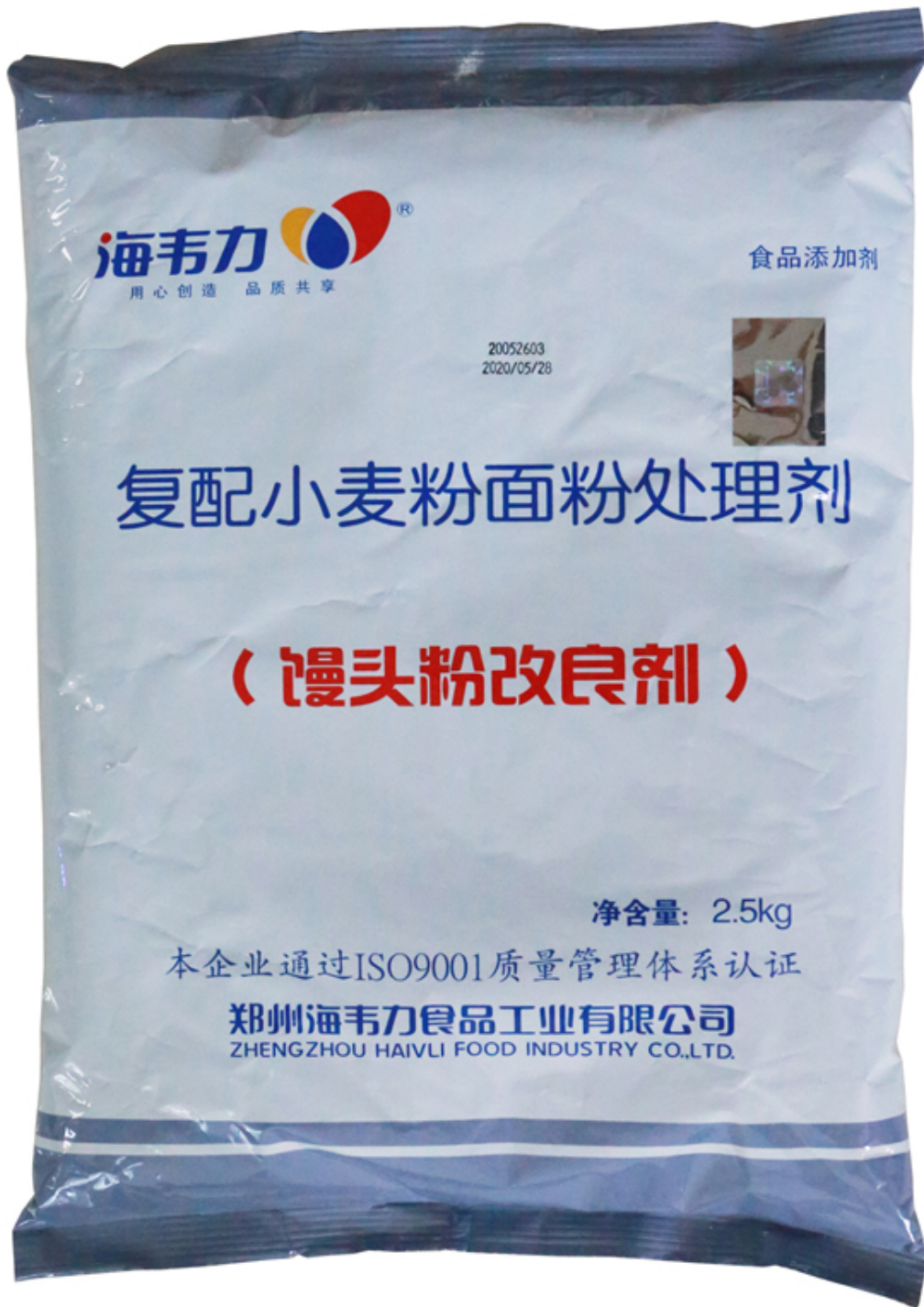
( 包装袋正面实物照 )