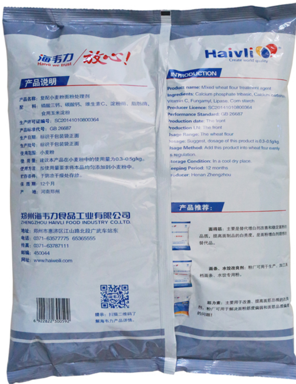
( 包装袋背面实物照 )