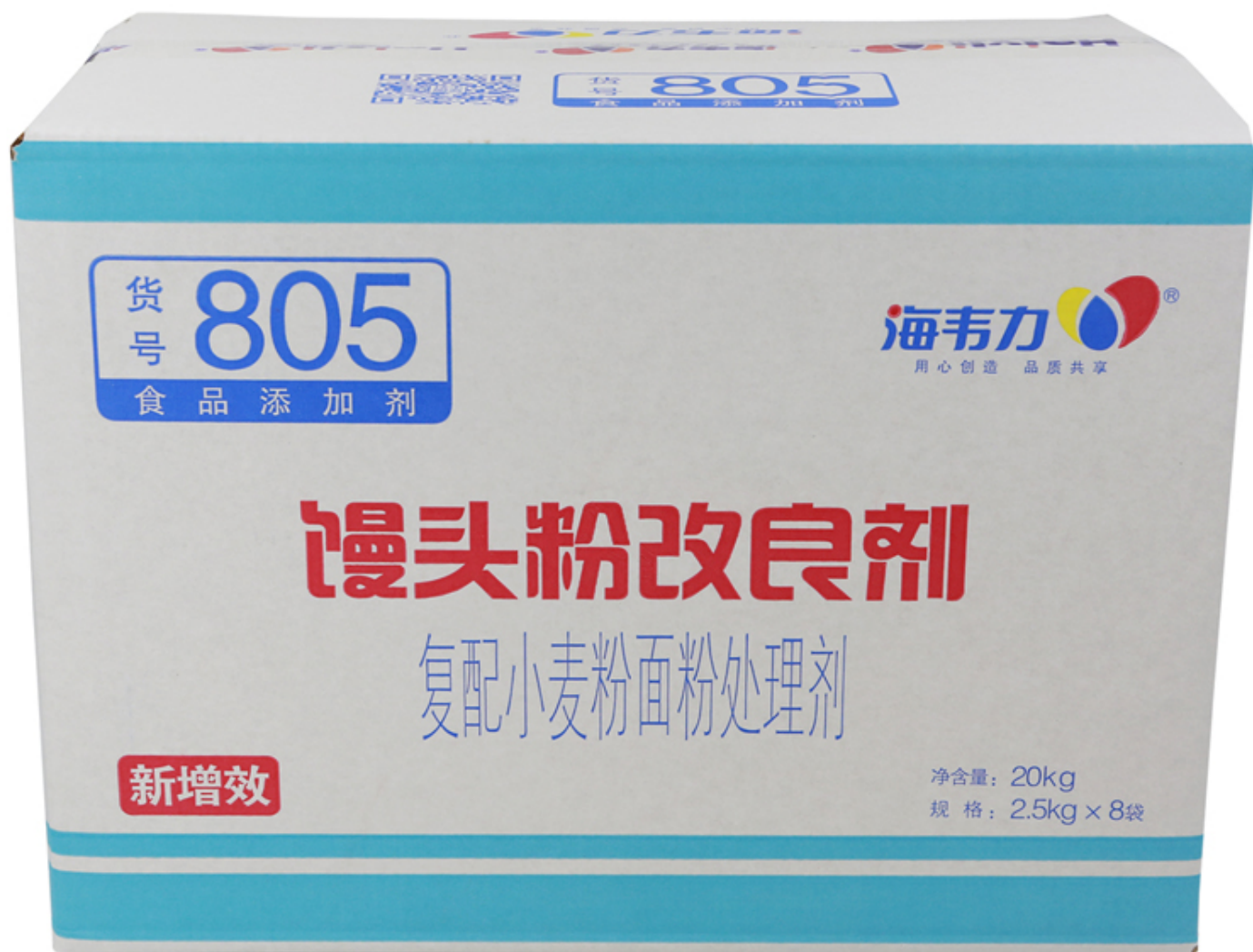
( 包装箱正面实物照 )